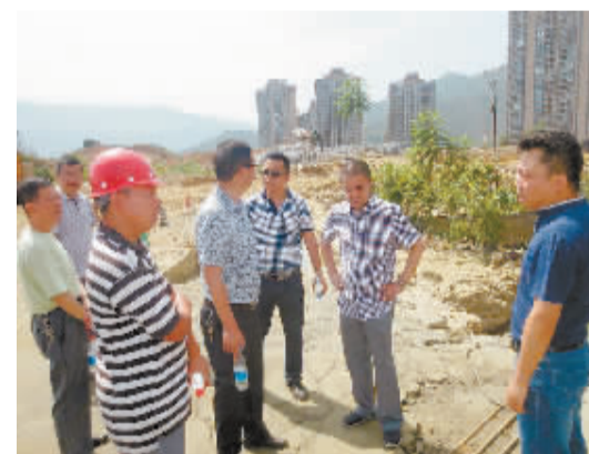
执法人员现场执法。