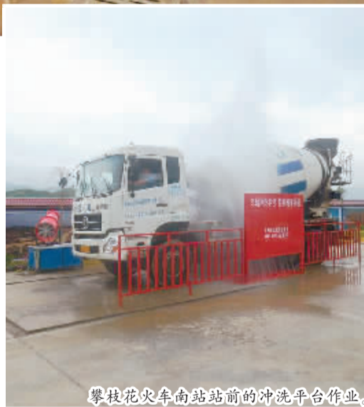
攀枝花火车站前的冲洗平台作业。