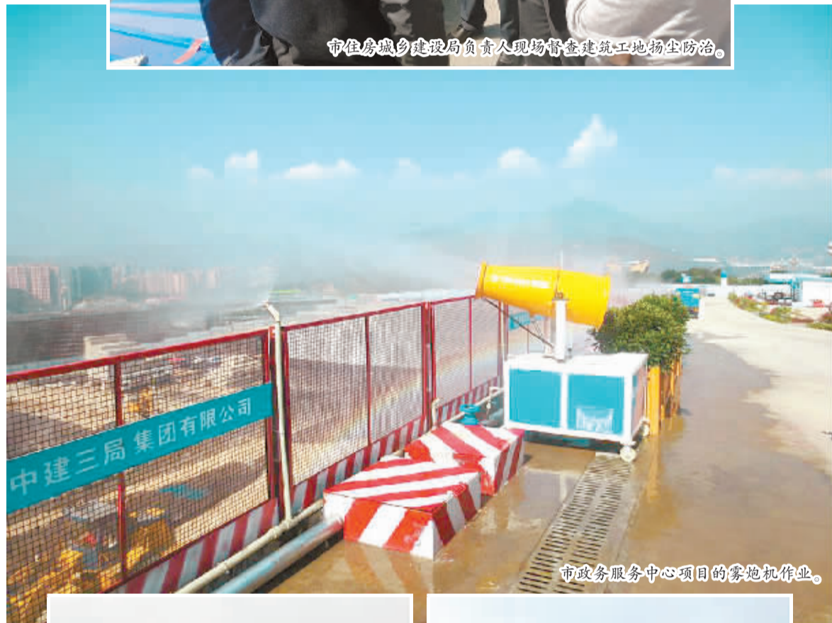
市政政务服务中心项目的雾炮机作业。