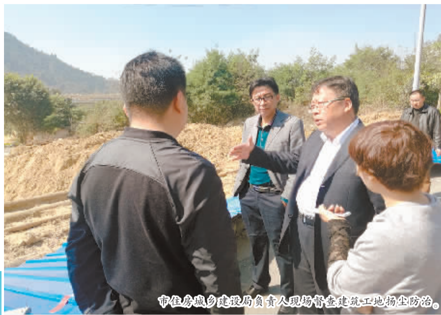
市住房城乡建设局负责人现场督查建筑工地扬尘防治。

目前，市区共有房屋建筑工地85个、市政基础设施工程9个，均按照有关标准基本整治到位。工地围挡、施工道路硬化以及规模以上建筑工地车辆冲洗率达100%，扬尘整治达标工地达95%。