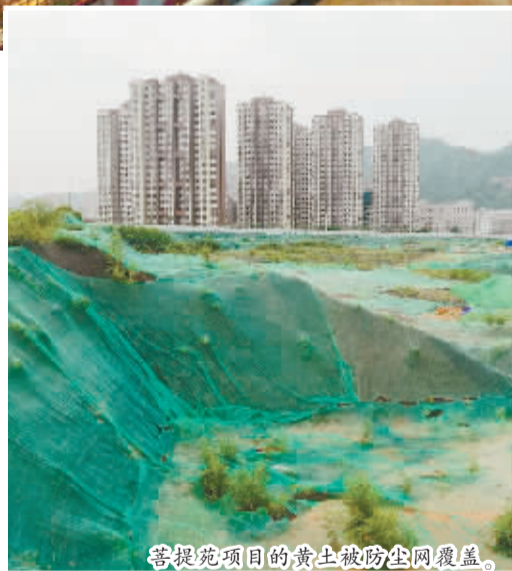
菩提苑项目的黄土被防尘网覆盖。