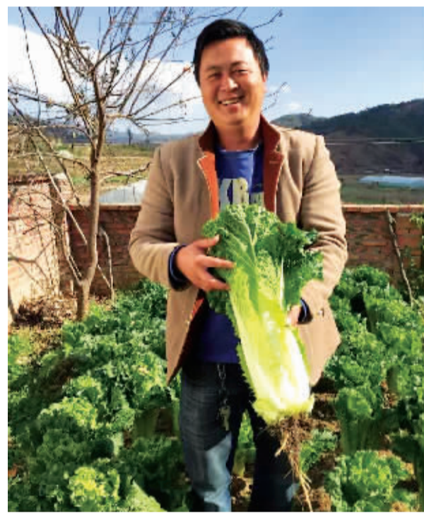
和爱乡的烂坝蔬菜种植户。

近年来，乡党委、政府高度重视乡村旅游发展，在县委、县政府及有关部门的关心帮助下，积极探索，大胆尝试，不断注入“康养”元素，将康养融入传统且有知名度的果蔬产业，同时以民族团结进步示范新村建设为契机，引进外资攀枝花星月谷康养服务有限公司，对团结民族新村进行康养旅游项目改造（攀枝花星月谷国际康养度假中心是集养老、旅游、休闲、度假及异地养老为一体的大型多功能康养度假中心），打造阳光康养和民族特色旅游产业，乡村旅游驶上发展的快车道。