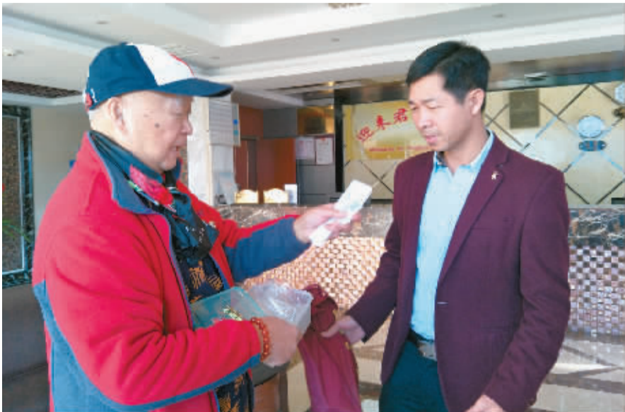
众多好心人帮老人找回药品。